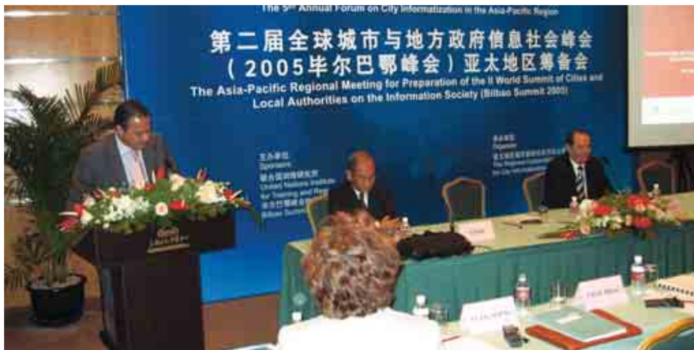
Reunión preparatoria celebrada en Shangai.

R epresentantes municipales de todo el mundo analizarán las claves que limitan el conocimiento y el acceso a las nuevas tecnologías para una gran parte de la población del planeta, entre los días 9 y 11 del próximo mes de noviembre en Bilbao, ciudad que acogerá la celebración de la II Cumbre Mundial de Ciudades y Autoridades Locales sobre la Sociedad de la Información.