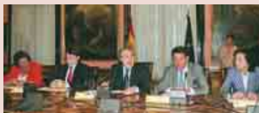
Representantes del Gobierno y de la FEMP durante la firma del Acuerdo sobre Medidas Urgentes de Financiación Local, el pasado verano.

En una norma con rango de Ley se regulará la compensación adicional de modo que ya se reconozca en el ejercicio de 2005 el importe de dicha compensación que se materializará en dos pagos. El primero, equivalente, como máximo, al 75 por ciento de dicha compensación, se realizará con cargo a los Presupuestos Generales del Estado del año 2005, y, el segundo, por el importe restante, dentro del primer trimestre de 2006, con cargo a los Presupuestos Generales del Estado de este año. ■