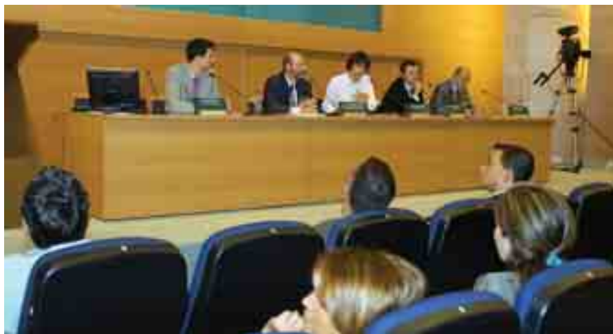
Un momento de la mesa redonda sobre experiencias europeas.

consecución depende en gran medida del uso del transporte privado.