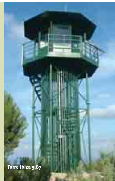
Torre Ibiza 5,87