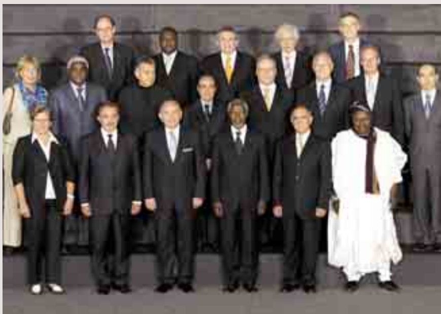
Los representantes de CGLU junto al Secretario General de Naciones Unidas, Kofi Annan, tras la reunión mantenida con él en los días previos a la Cumbre.

pública de la Asamblea General con representantes de Organizaciones no Gubernamentales, de la sociedad civil y del sector privado. ■