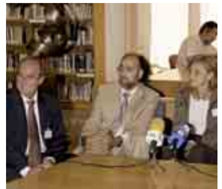
El Alcalde de Albacete, Manuel Pérez Castell; el Director General del Libro, Rogelio Blanco; y la Subdirectora General de Coordinación Bibliotecaria, Antonia Carrato.

La propuesta de que los Ayuntamientos no abonen el citado canon fue formulada por el Presidente de la Comisión de Cultura de la FEMP, Manuel Pérez Castell, Alcalde de Albacete, que recordó que más del 96 por ciento de las bibliotecas públicas son municipales y que "la aportación de los municipios a esta red de centros de lectura no se puede ver incrementada con el canon, porque los Ayuntamientos ya soportamos el 70,4 por ciento del mantenimiento de la Red Bibliotecaria" . El Director General del Libro,