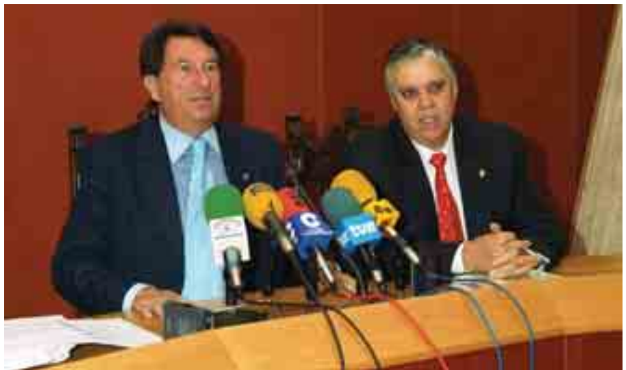
El Presidente de la FEMP, Francisco Vázquez, con el Alcalde de Villafranca de los Barros, Ramón Ropero.

Respecto al avance de los Presupuestos Generales del Estado (PGE) de 2006 para