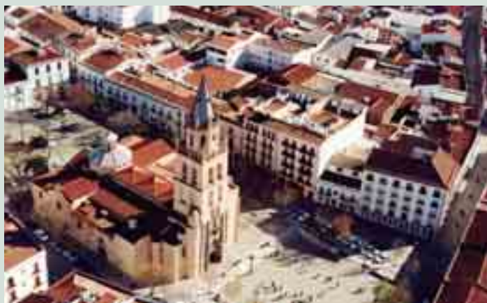
Vista aérea de Villafranca de los Barros.

Villafranca de los Barros (12.618 habitantes) se encuentra situada en el corazón de la Tierra de Barros (Badajoz) en la Ruta de la Plata. Ocupa el centro de una dilatada cuenca de tierra arcillosa, entre Sierras de Alance, Hornachos y Fuente del Maestre. Actualmente la agricultura representa el 12,10 por ciento, la industria el 16,70 por ciento, la construcción el 17,10 por ciento y el sector servicios el 54,10 por ciento. Por su tradición musical es denominada como la Ciudad de la Música. ■