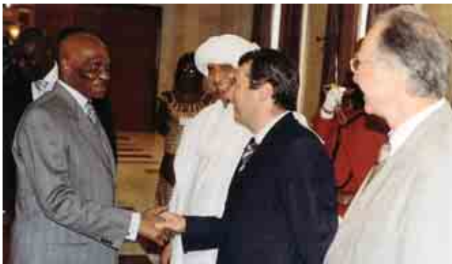
Representantes de Bilbao 2005, en Dakar.

En la Cumbre de Lyon se identificaron, además, las áreas clave para el desarrollo de la sociedad de la información, definiendo las bases del trabajo común y la disposición de los instrumentos fundamentales de trabajo. Por un lado, la Red IT4ALL (Red de Autoridades Locales para la Sociedad de la Información), plataforma de cooperación e intercambio de experiencias entre ciudades y regiones del mundo; y por otro el Fondo de Solidaridad Digital, que financia proyectos para el desarrollo de las tecnologías de la información en los países y regiones menos desarrollados. Tanto la Declaración como los resultados de Lyon, fueron llevados pocos días después a la Cumbre Mundial de Ginebra.